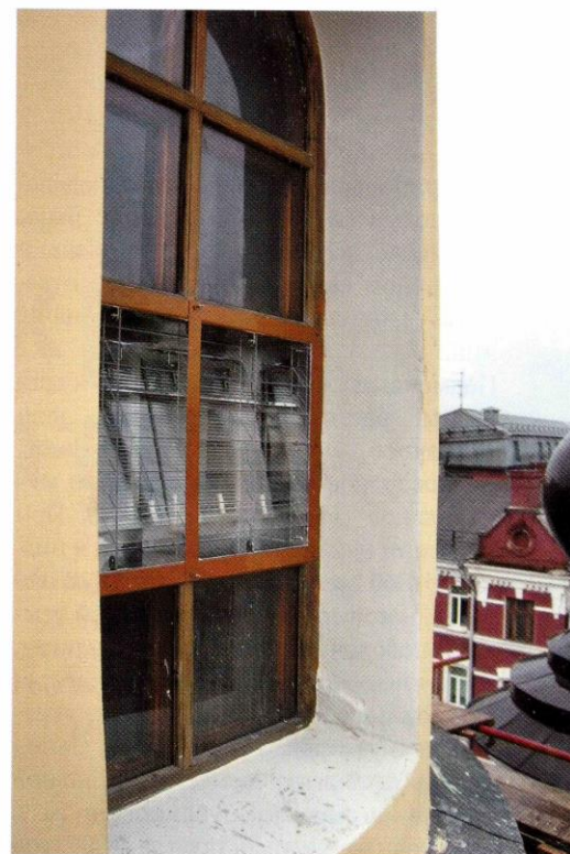
Пример использования аэрационных устройств для естественной вентиляции церковных зданий